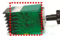
(対象) (裏面端子台付スイッチ)