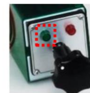
(ランプ付スイッチ) (ランプ付ドラムスイッチ)