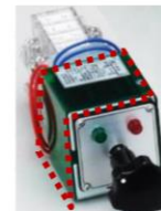
(ランプ付スイッチ)